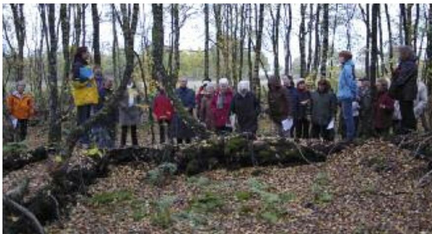
In Seminaren schulen Fachleute des NHB Ehrenamtler in den Regionen.

Aus Sicht des NHB bestehen die konkreten Aufgaben und Anforderungen eines Heimatbundes im 21. Jahrhundert darin: