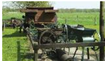
Gerätschaften auf der Anlage