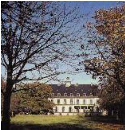
Schloss Hohehorst in Löhnhorst