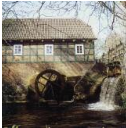
Die Wassermühle in Meyenburg

Eines von vielen lohnenswerten Ausflugszielen ist die Ortschaft Meyenburg mit seinem idyllischen Dorfkern und der Wassermühle.