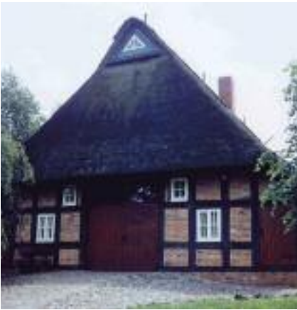
Das Küsterhaus in Schwanewede