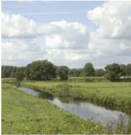
St. Jürgensland

Im Kulturzentrum „Murkens Hof“ befindet sich das KULTURamt Lilienthal, die Bibliothek sowie die Volkshochschule Lilienthal-Grasberg-Ritterhude-Worpswede. Hier finden Kunstausstellungen, Konzerte und andere kulturelle Veranstaltungen statt. Murkens Hof beheimatet auch die „Lilienthaler Kunststiftung“, die in Retrospektiven Werke von Künstlern aus dem Kulturdreieck Worpswede-Fischerhude-Lilienthal ausstellt.