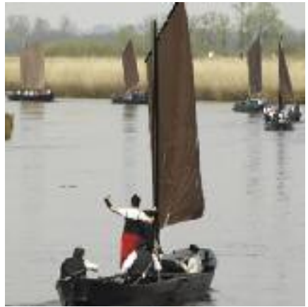
Torfkähne Wümme

Die Geschichte wird in den Lilienthaler Museen wieder lebendig: im „Heimatmuseum Lilienthal“ mit seiner umfangreichen Lilienthal-Bibliothek, im „Niedersächsischen Kutschenmuseum“ mit den historischen Fuhrwerken oder im „Schulmuseum“, wo Schulunterricht wie vor 100 Jahren zum Erlebnis wird. Auf der Museumsanlage Lilienhof mit Gebäuden aus dem 17. und 18. Jh. werden alte Traditionen durch Backtage und andere Veranstaltungen aufrechterhalten. Auf dem Gelände steht auch das Handwerkermuseum, in dem altes Handwerk leben-