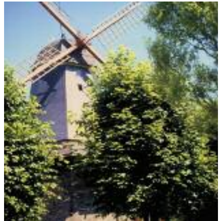
„Galerie Holländer“ in Aschwarden

Galionsfiguren, die stolze Segelschiffe schmücken, entstehen in einer Holzwerkstatt auf der Insel Harriersand. In Meyenburg lebt ein international anerkannter Geigenbauer.