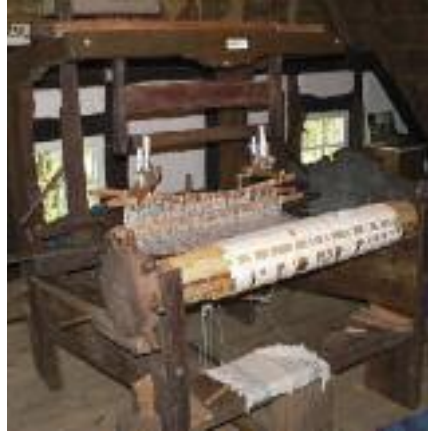
Webstuhl im Museum des Heimathauses