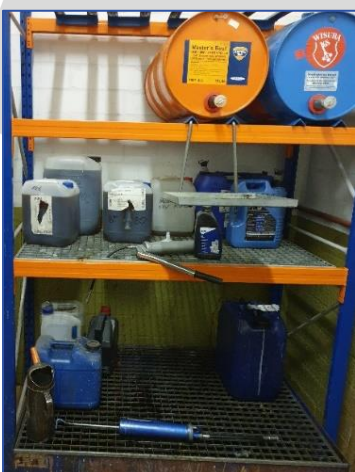
Regalsystem mit integrierter Auffangwanne

Zweckmäßig und damit übliche Praxis ist es, Frisch - und Altöl an einer Stelle gemeinsam zu lagern.